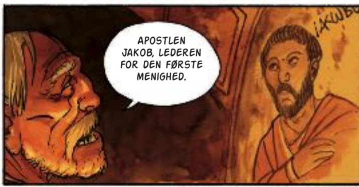
Et svagt lysskær over de fjerne forfædre.

APOSTLEN JAKOB, LEDEREN FOR DEN FØRSTE MENIGHED.