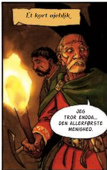
Et kort øjeblik

JEG TROR ENDDA... DEN ALLERFØRSTE MENIGHED.